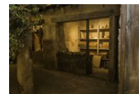
@APDAE - Visite contée